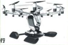
空飛ぶクルマ実機(LIFT AIRCRAFT)