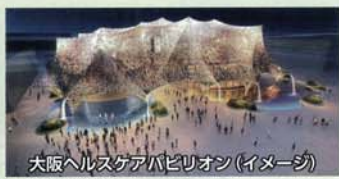
大阪ヘルスゲートパビリオン(イメージ)