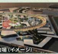
万博会場(イメージ)

会場建設費や大阪メトロ中央線の輸送力増強事業費を負担するとともに、機運醸成や参加促進、大阪パビリオンの建設、展示の企画などの事業を実施。